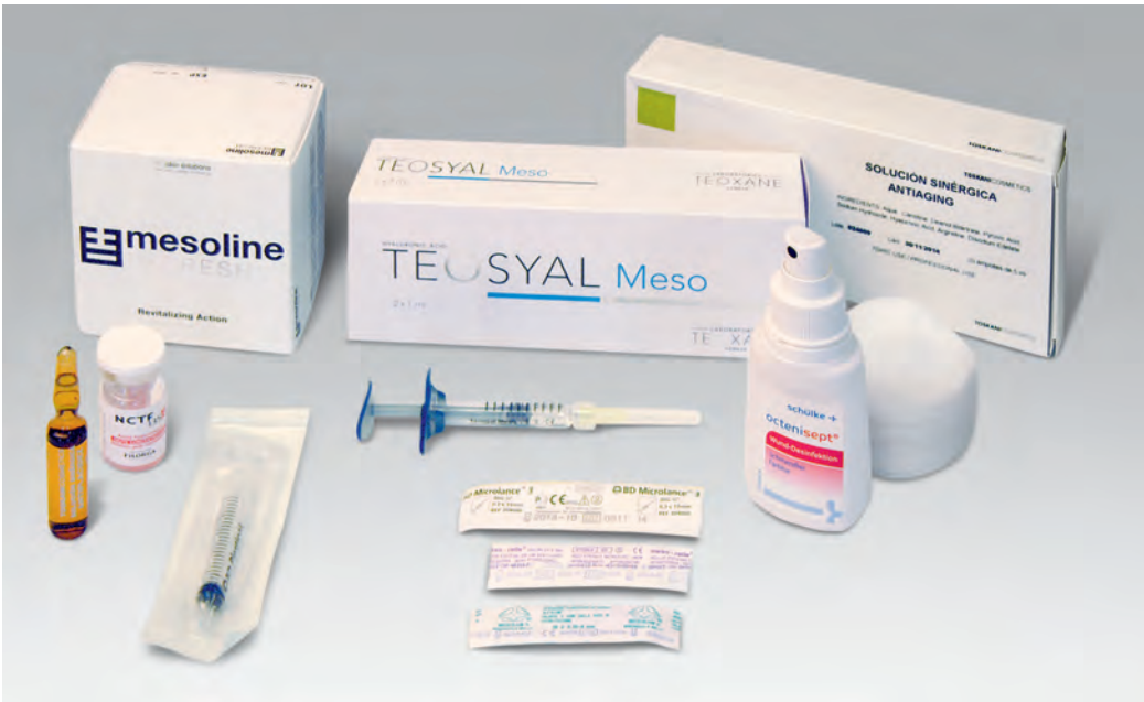
Auswahl von Produkten für den Mesolift zur Hautverjüngung

Obwohl die Herstellungsweise dieses Schönheitselixiers befremdlich, um nicht zu sagen unappetitlich, in unseren Ohren klingt, hätte die Analyse dieses organischen Gemisches Erstaunliches zutage gebracht: Nachweisbar wären auch heute noch topaktuelle Wirkstoffe wie Vitamin E, ungesättigte Fettsäuren und Antioxidanzien (aus dem Olivenöl), sowie Hyaluron, Elastin, Keratin, Kalzium, Aminosäuren, Enzyme, hormonelle Wirkstoffe und Nukleinsäuren (aus der Maus).