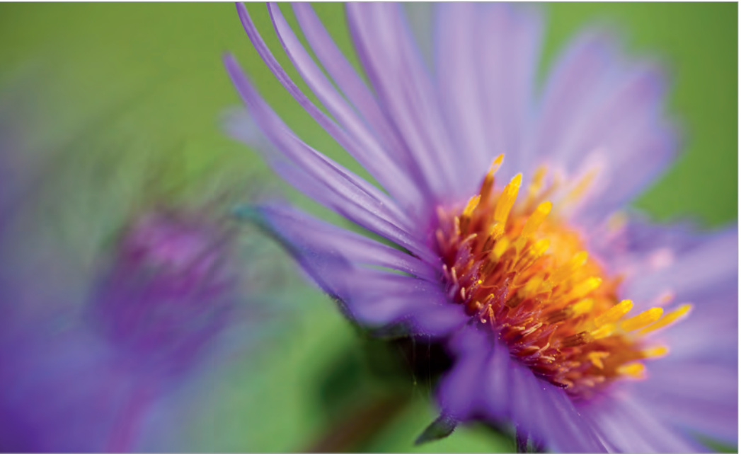
Verträumte Farben der heimischen Herbstaster: die Schönheit später Blüte

Der große Vorteil der erstgenannten fünf sanften Maßnahmen und ihrer biologisch abbaubaren Aktivstoffe ist ihre zeitliche Begrenztheit, im Gegensatz zur Endgültigkeit operativer Eingriffe. Es kann also immer wieder neu entschieden, modelliert und korrigiert und damit der Alterungsprozess flexibel begleitet werden. Der Arzt bleibt oft Ihr langjähriger Berater und Beauty-Coach. Eine Operation hingegen bringt ein schnelles und definitives Ergebnis.